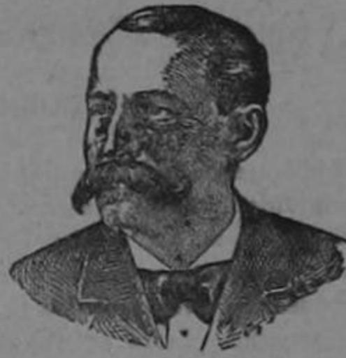
Marca de Fábrica registrada